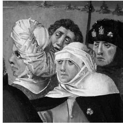
Ausschnitt Heiligenthaler Altar , Malschule Borneemann, 15. Jh., Pilger und Pilgerinnen mit Pilgerzeichen an Hut und Kleidung, St. Nikolaikirche, Lüneburg, Niedersachsen.