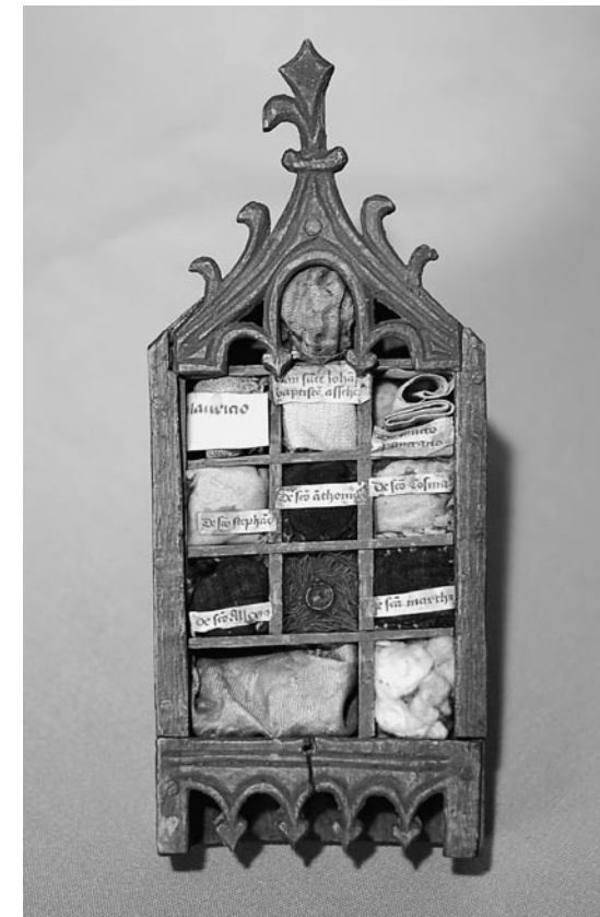
Reliquiar aus St. Johannis, um 1500, Lüneburg, Museum für das Fürstentum Lüneburg, Lüneburg, Niedersachsen.